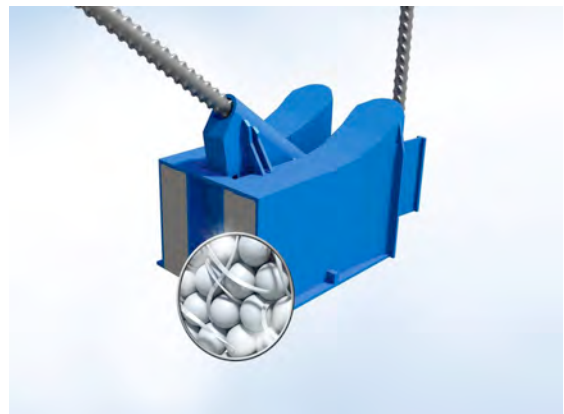
Module HTE (Brevet Schöck)

Les modules de compression HTE, brevetés par Schöck, ont également été optimisés. Le module est fabriqué à partir de béton fibré à ultra haute performance (Ultra High Performance Concrete, UHPC) avec le nouveau matériau Kronolith. La conductibilité thermique est ainsi réduite de plus de 40 % par rapport à l'ancien module HTE actuel. Il offre une combinaison optimale de transmission des efforts et d'isolation thermique.